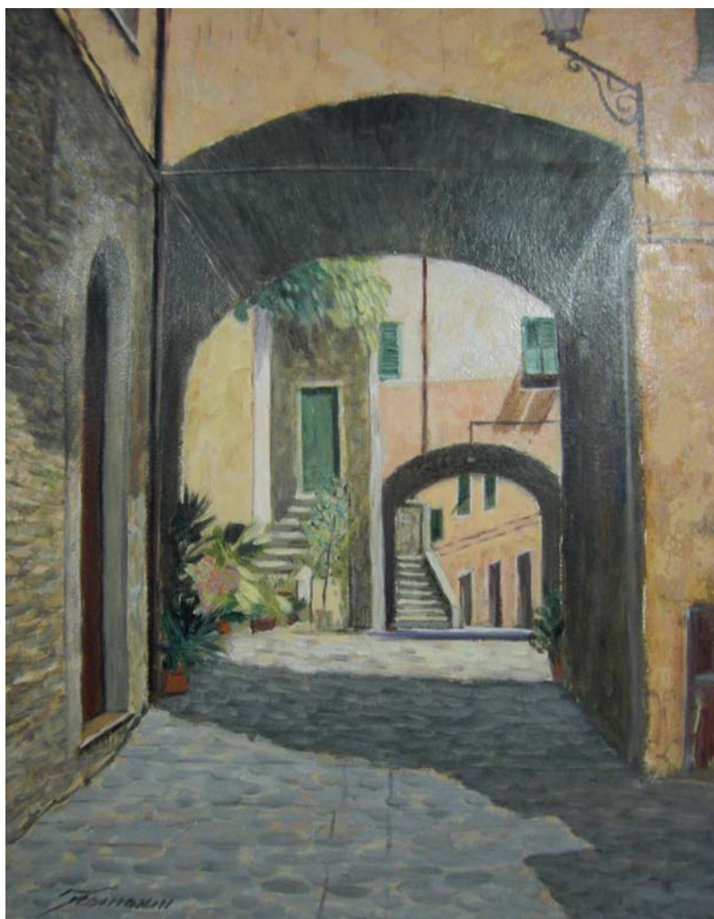
- Arcola, via Doria -

Viva er vin, che l'aigua l'è sta' 'a rovina der pian d'Arcoa.