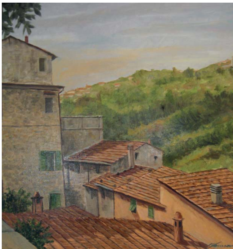
- Arcola e il monte -