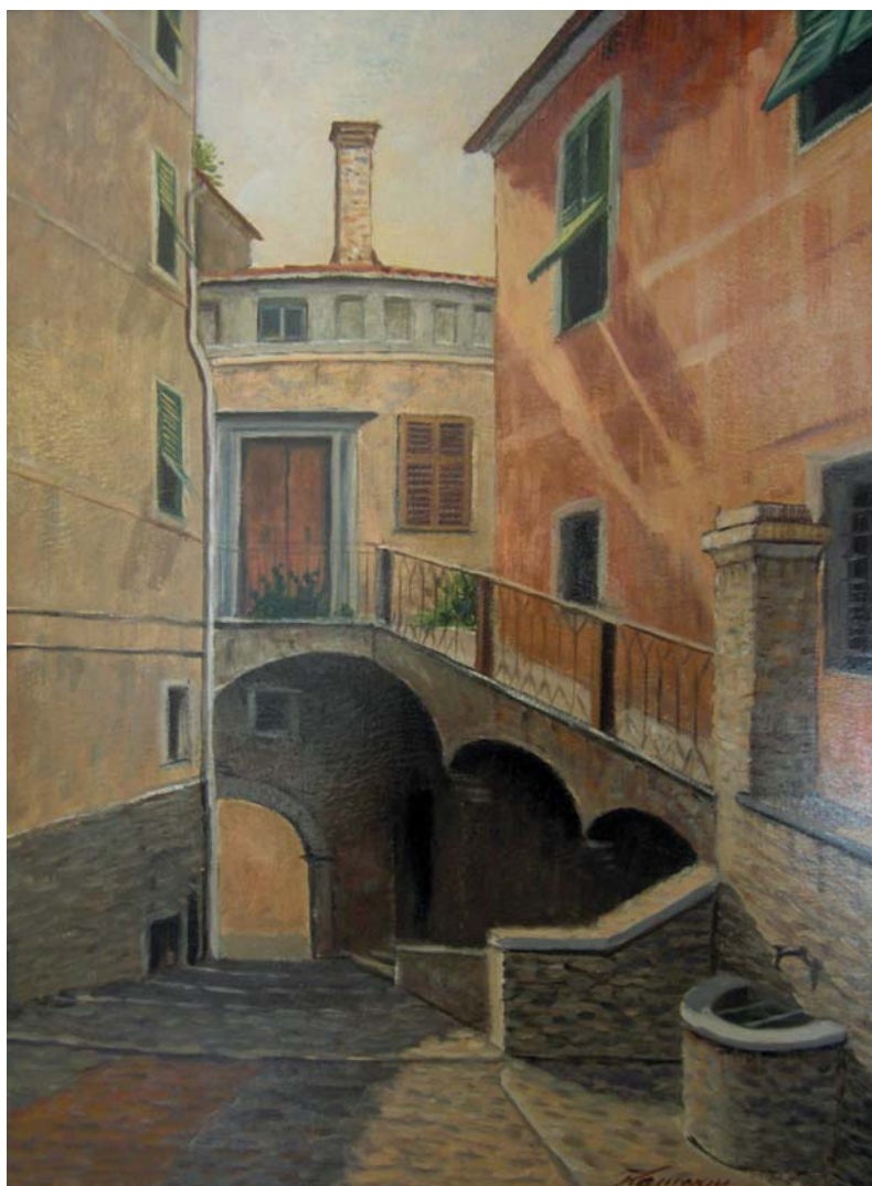
- Arcola -

Quando ja nuvoa la vienen dar mae pigia a zapa e va a zapae.