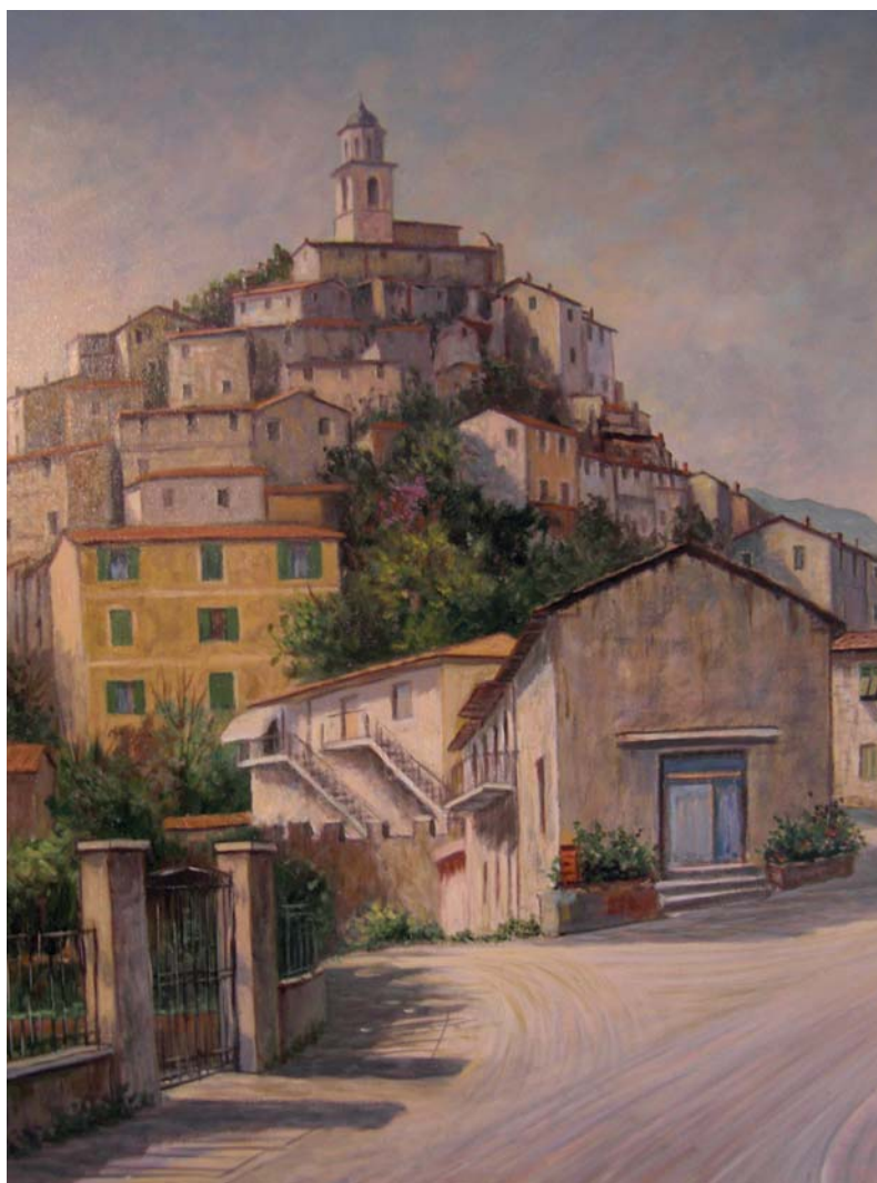
- Arcola -

Er balo g'è de moda: chi ne bala, scrola.