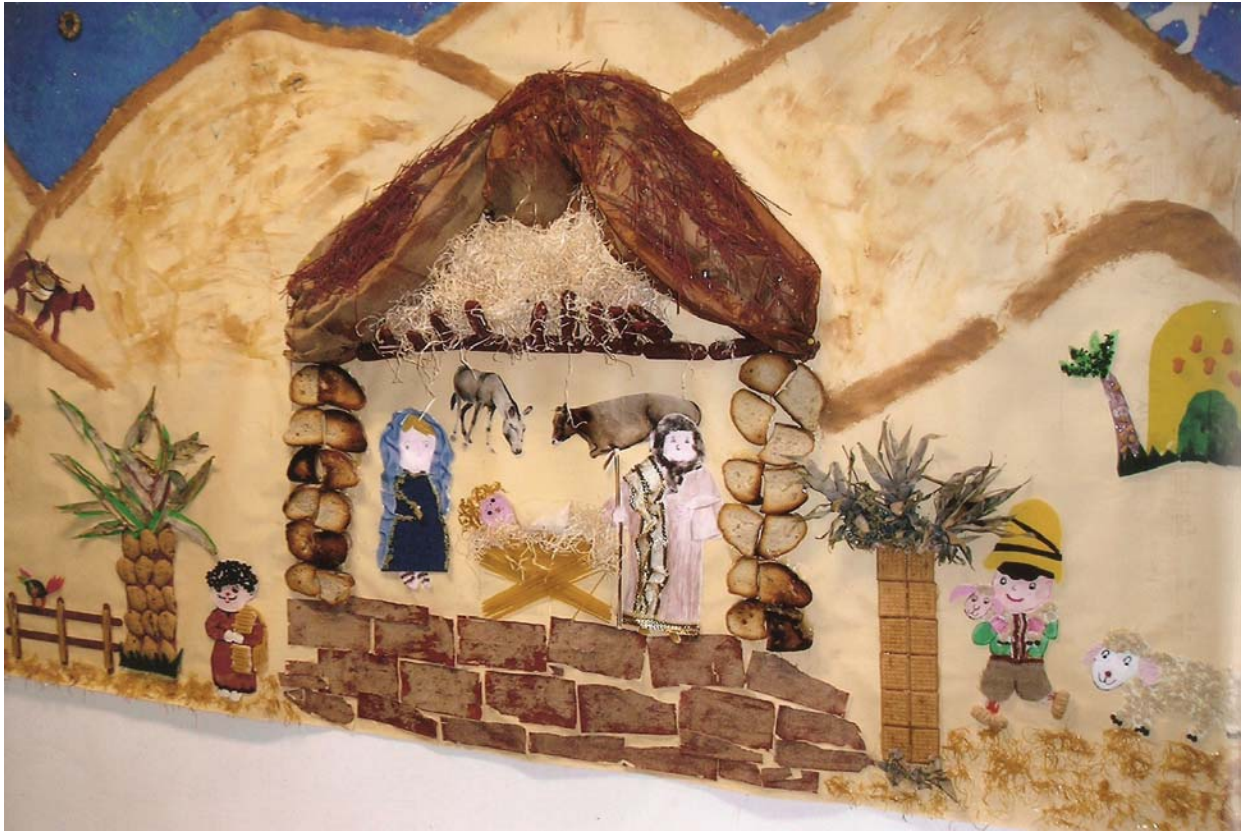
Scuola Materna e dell'Infanzia di Romito Magra