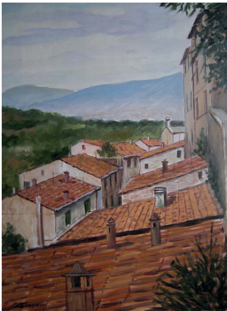
- Arcola -