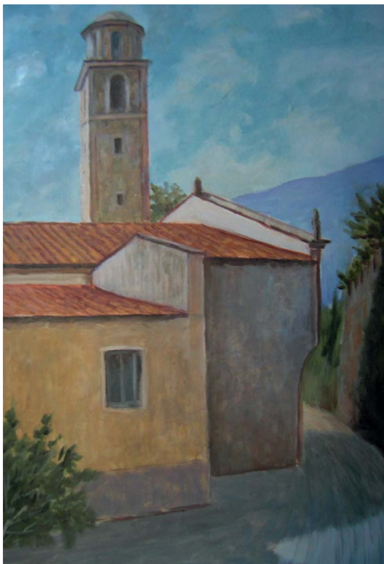
- La Pieve di Arcola -