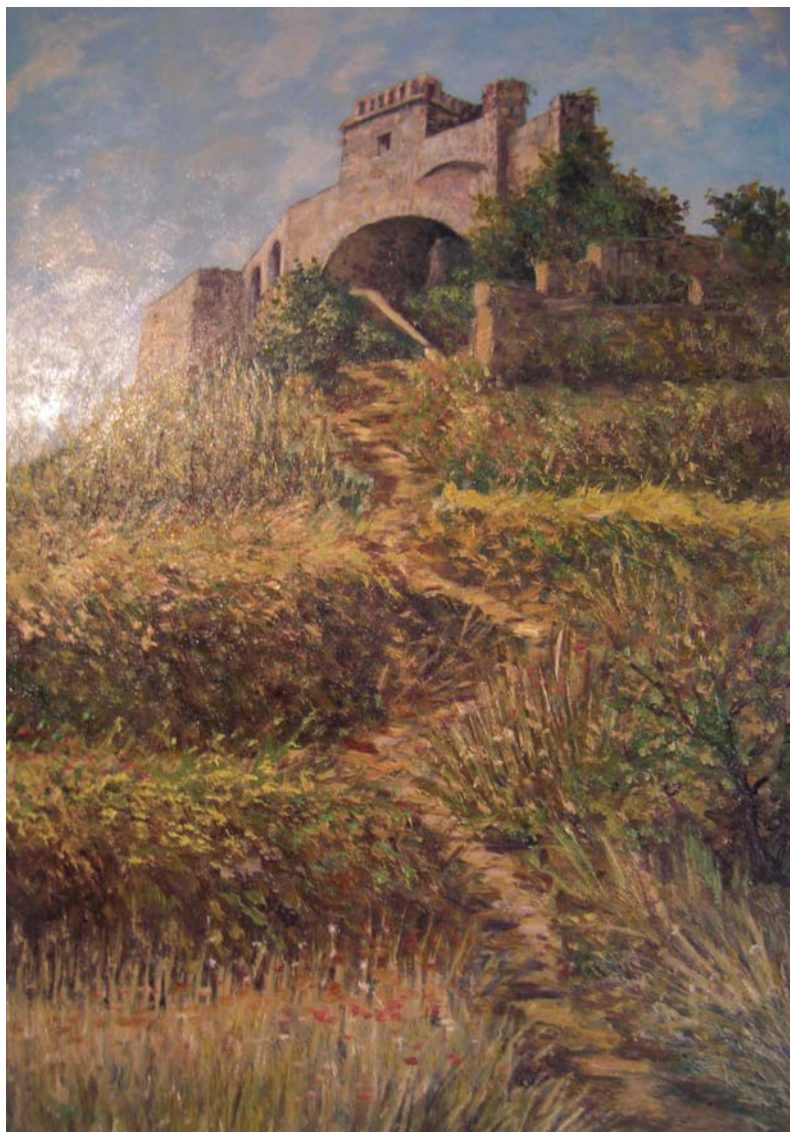
- Castello di Trebiano -

Ma che bela figia: tuti la vonen, ma nissun la pigia.