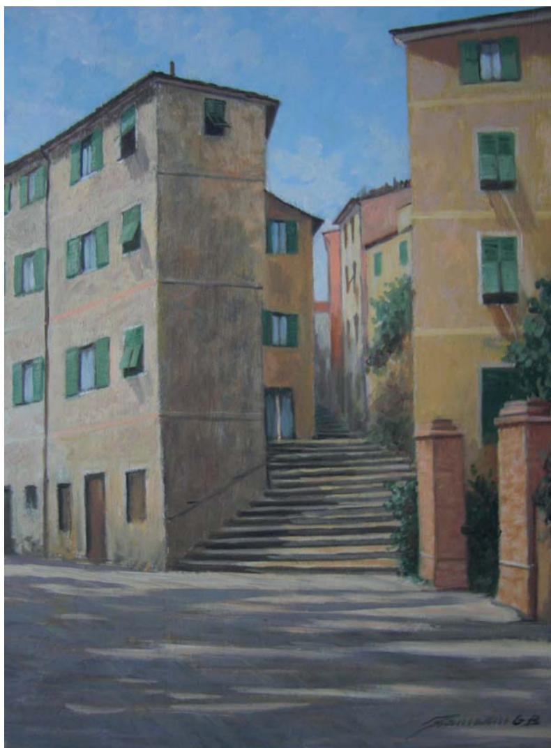
- Arcola, via Valentini -