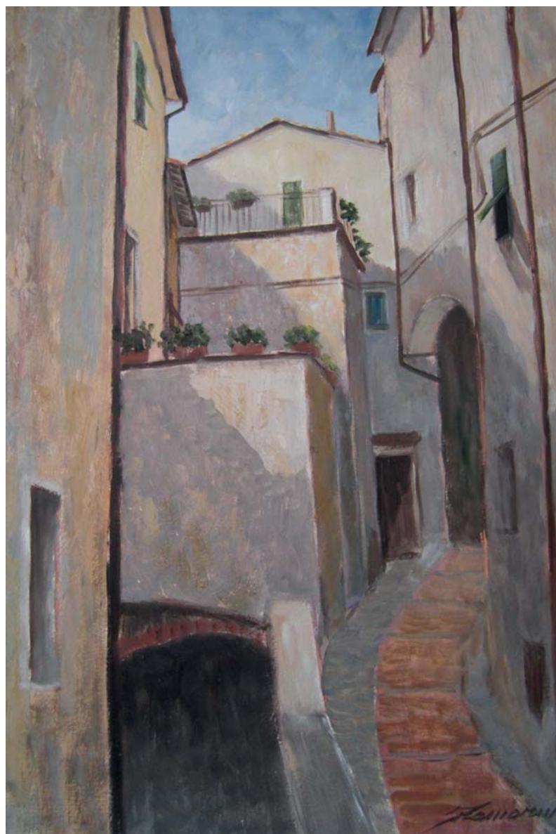
- Arcola -