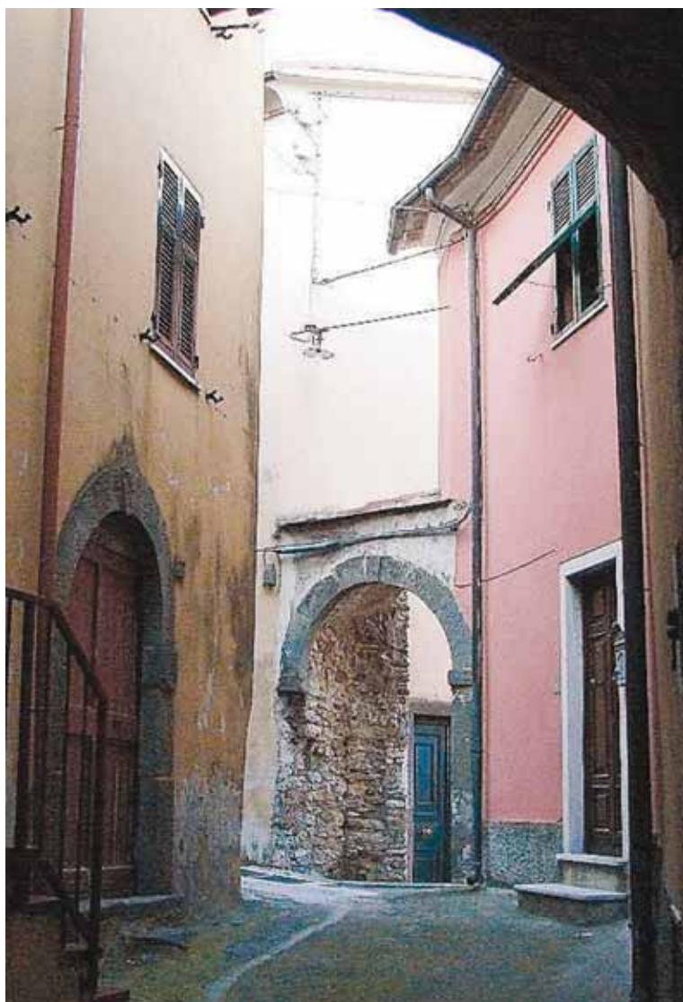
Baccano - Montedegalli