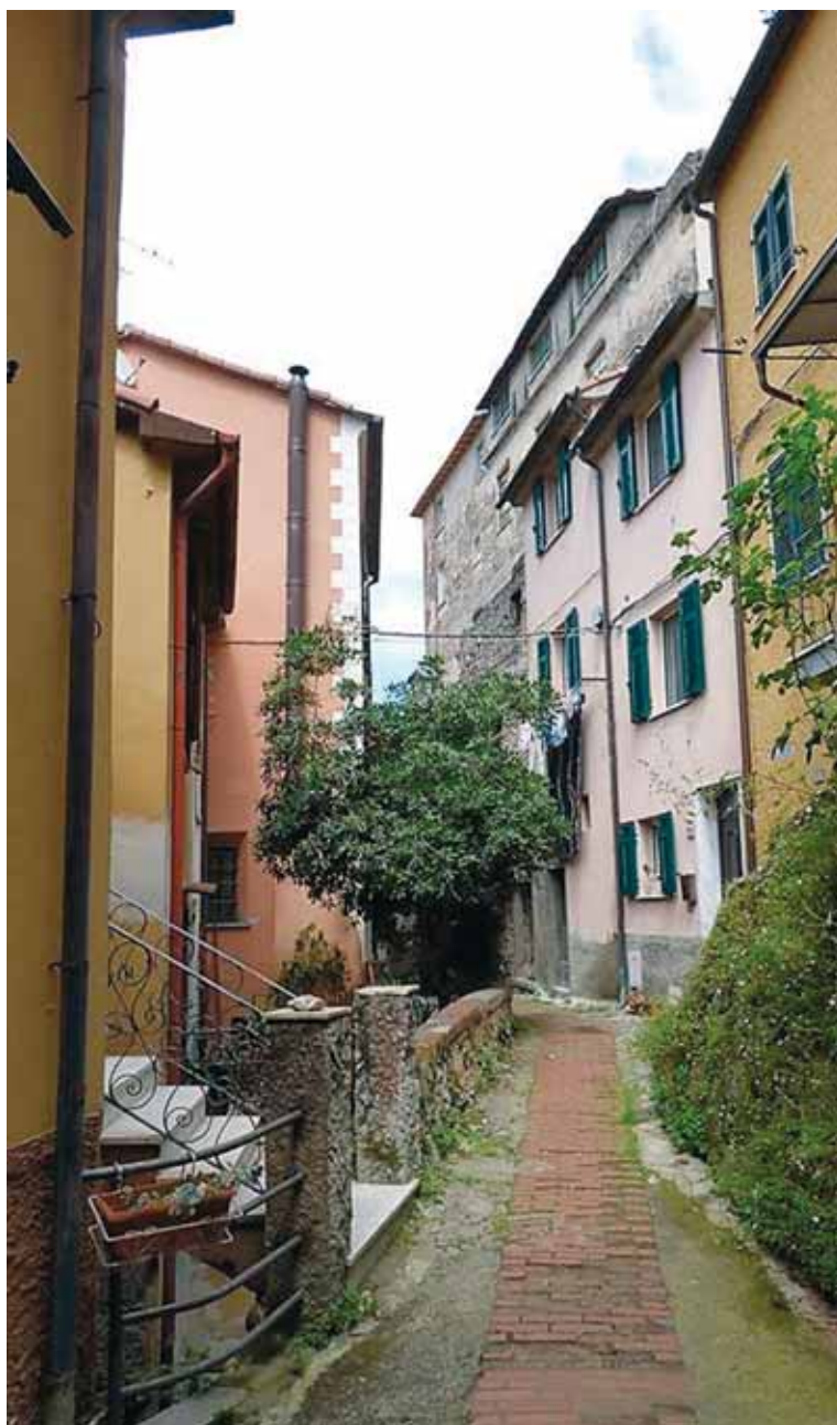
Via Oberto Doria