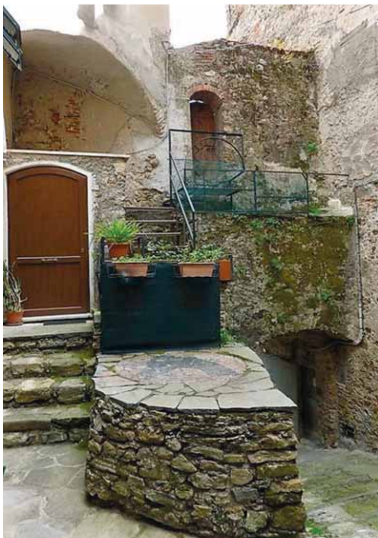
Via Valentini - Porta delle Fontane