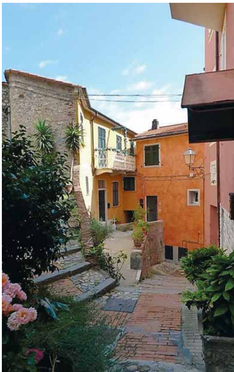
Via Renzo Picedi