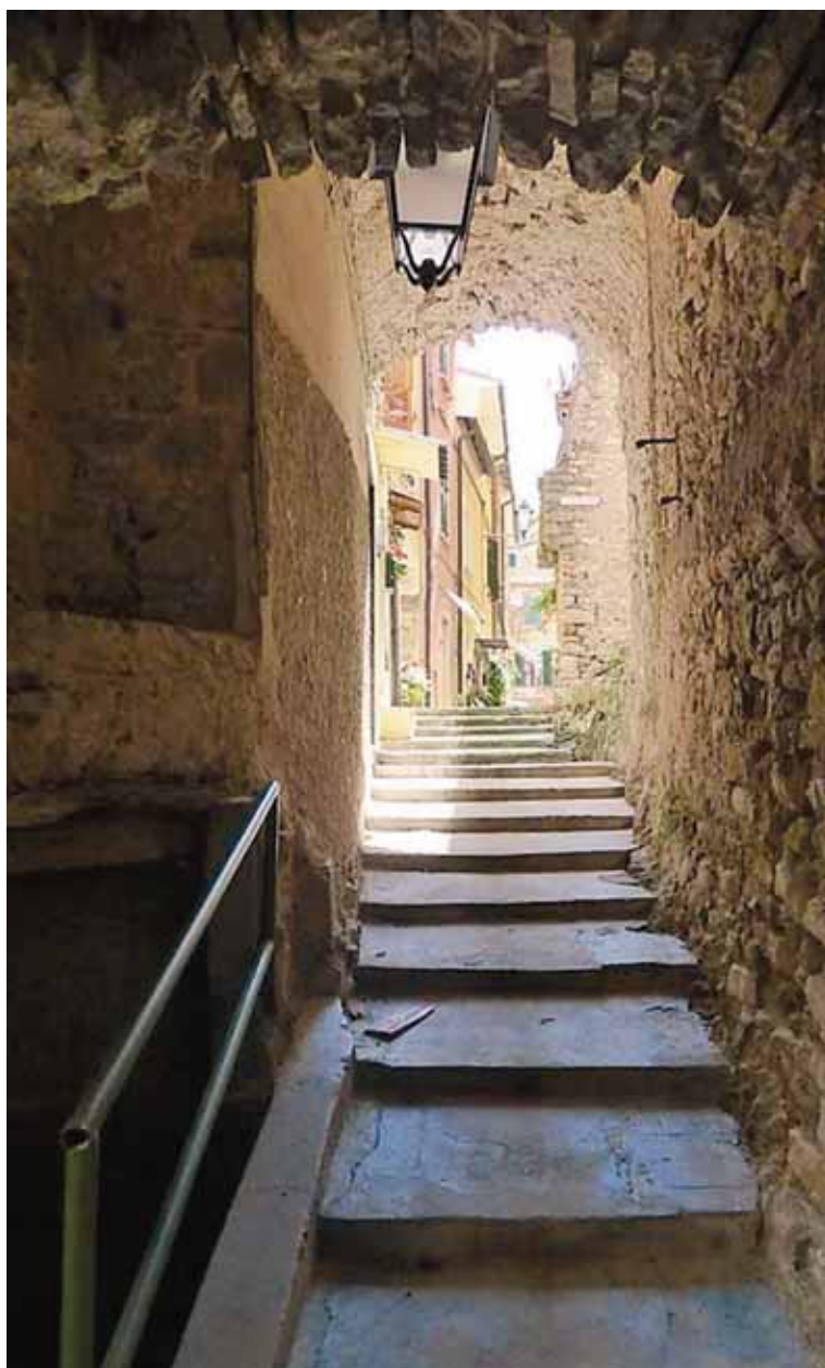
Via E. Bernabò