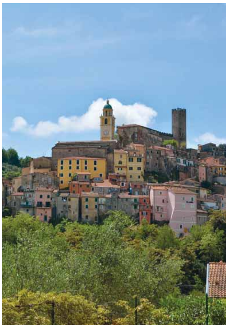
Arcola - il borgo